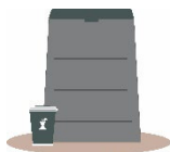
Utiliser un composteur