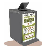
Déposer en point de collecte

Pour obtenir un composteur gratuit (offre limitée à un composteur par foyer), inscrivez-vous à l'atelier gratuit d'une heure. Pour connaître les dates et vous inscrire en ligne : https://sictomsudgironde.fr/evenements/ ou 07 85 15 58 18 ou par mail à reservation@sictomsudgironde.fr .