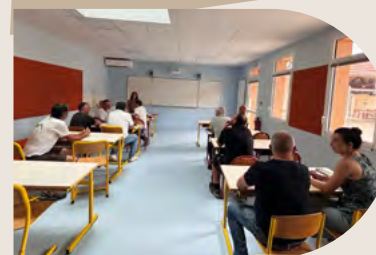
La salle de classe