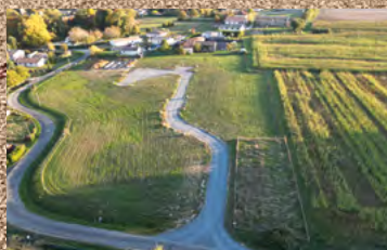
LES PROJETS COMMUNAUX