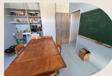
La salle de soutien et de repos

C'est ainsi que, le 04 octobre dernier, nous avons ouvert les portes de l'école de Bieujac, aux habitants de Bieujac et de St Pardon de Conques afin de leur faire découvrir ou redécouvrir ce lieu emblématique de notre commune.