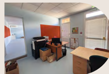
Les bureaux des directions : école et périscolaire