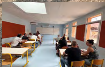
LA RESTRUCTURATION DE L'ÉCOLE